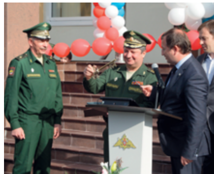
Открытие школы IT-технологий

В соответствии с решениями Министра обороны Российской Федерации №173/УВО/4/5642 от 31 октября 2014 года и №173/УВО/4/6055 от 17 ноября 2014 года на базе Военной академии связи (далее Академия) был создан Кадетский корпус (школа IT-технологий, далее Школа).