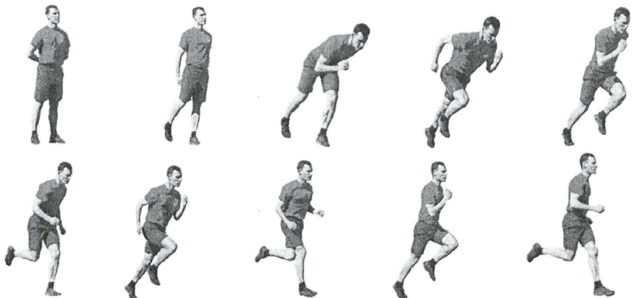
Рис. 2. Бег на 100 м

При нарушении условий выполнения упражнений предоставляется вторая попытка, при повторном нарушении упражнение считается невыполненным.